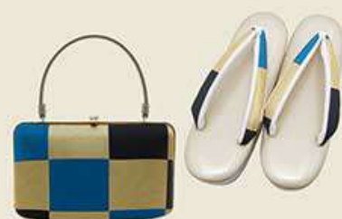
草履バッグセット