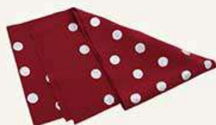
半衿 (長襦袢への付け代込)