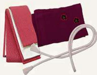
重衿・帯揚・帯メ 3点セット