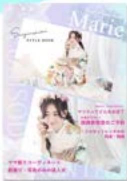
システムや料金などをご紹介 スタイルBOOK