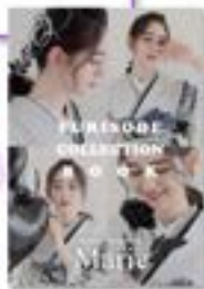
スタイル提案冊子 コレクションBOOK