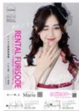
展示会情報などのご案内 リーフレット